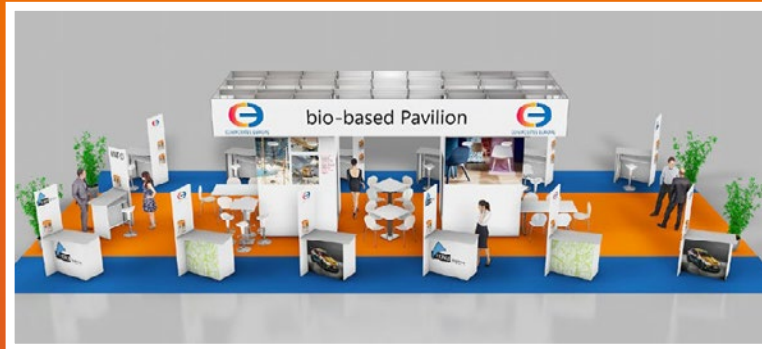
Beispielhafte Abbildung. Änderungen vorbehalten.