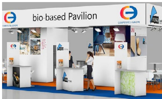
Beispiel-Standbau, Änderungen vorbehalten.

Werden Sie Teil des „bio-based composites“ Pavillons. Der Gemeinschaftsstand befindet sich zentral im Faserbereich in Halle 7 am Stand A45.