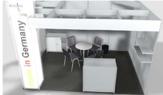
Beispiel-Standbau, Änderungen vorbehalten.