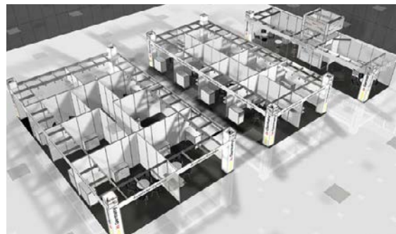
Beispiel-Standbau, Änderungen vorbehalten.