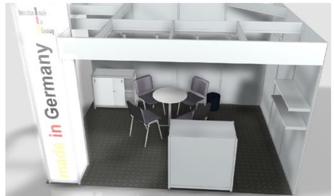
Beispiel-Standbau, Änderungen vorbehalten.