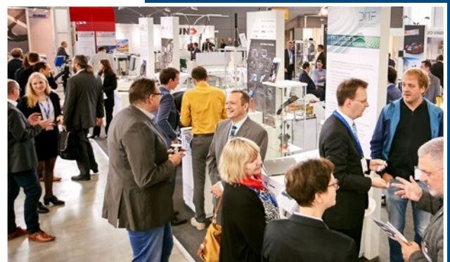
COMPOSITES EUROPE 2017

Gefördert wird die Teilnahme an einem Gemeinschaftsstand in der Halle 7 der COMPOSITES EUROPE 2018. Neben Ihrem Stand beinhaltet diese Gemeinschaftsfläche auch eine Catering-Zone, die von allen Teilnehmern des Standes jederzeit für Kundengespräche genutzt werden kann. Teilnehmer am Gemeinschaftsstand sind ausschließlich durch das BMWi geförderte Unternehmen der COMPOSITES EUROPE.