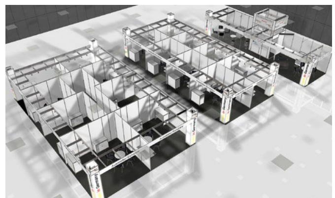
Beispiel-Standbau, Änderungen vorbehalten.