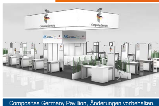
Composites Germany Pavillion, Änderungen vorbehalten.