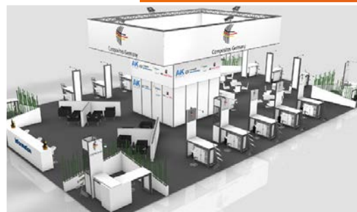
Composites Germany Pavillion, Änderungen vorbehalten.