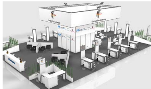
Composites Germany Pavilion, Änderungen vorbehalten.